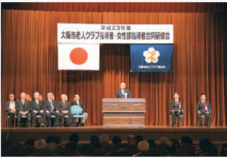
大阪市老人クラブ指導者・女性指導者合同研修会であいさつする中理事長

昭和33年9月19日第三種郵便物認可 〒556-0017 大阪市浪速区湊町1-4-1 OCATビル 社団法人 大阪市老人クラブ連合会 発行所 大阪府浪速区湊町1-4-1 編集室 電話 06(6635)3227 FAX 06(6635)3229