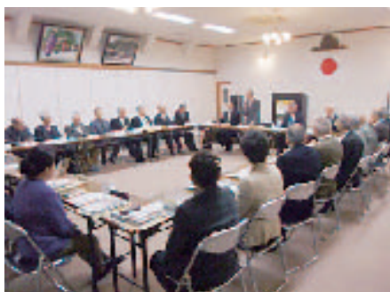
参集殿会議室で開かれた1月会長会