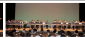
港区老連のピアノ演奏