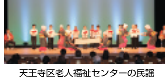
天王寺区老人福祉センターの民謡