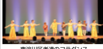
東淀川区老連のフラダンス