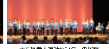
大正区老人福祉センターの民謡